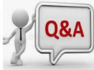
Q & A